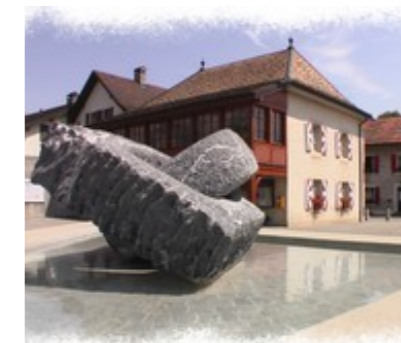
Place du Lien, Crassier

Matériel à envoyer à : commune@crassier.ch