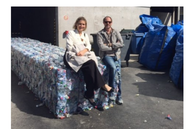
Deux municipaux triés sur le tas Journée UCV, visite RC Plast SA