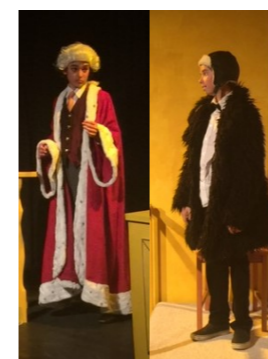
Juge et Loup de retour à Crassier A l'atelier de Mademoiselle F.