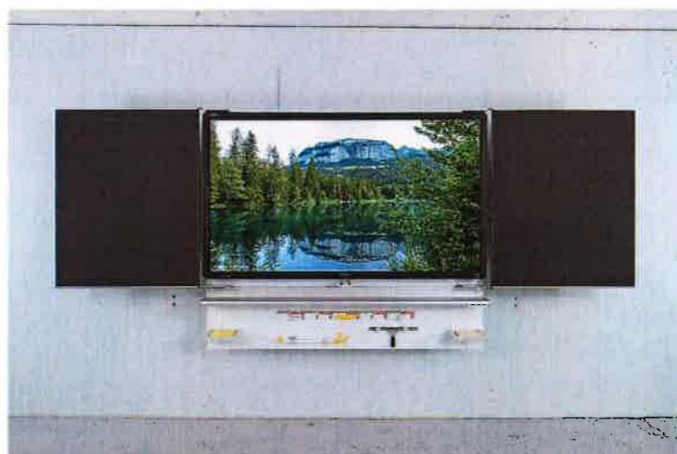
Fig. 2 : ANF intégré à un tableau existant (dimension tableau 1193mm x 2000mm)

Des supports mobiles individuels sont également prévus pour l'installation d'ANF dans les locaux où une installation fixe n'est pas souhaitée.