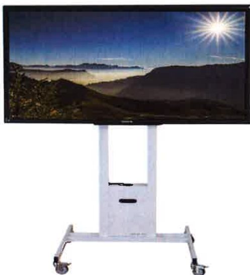
Fig. 3 : ANF sur support mobile